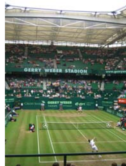
Tennis & Golf