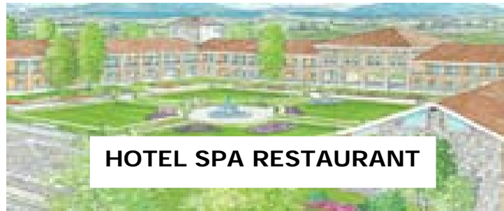
HOTEL SPA RESTAURANT

Autobahn Mailand-Brescia – Abfahrt Sirmione – Richtung Pozzolengo- kurz vor Pozzolengo rechts abbiegen nach San Vigilio