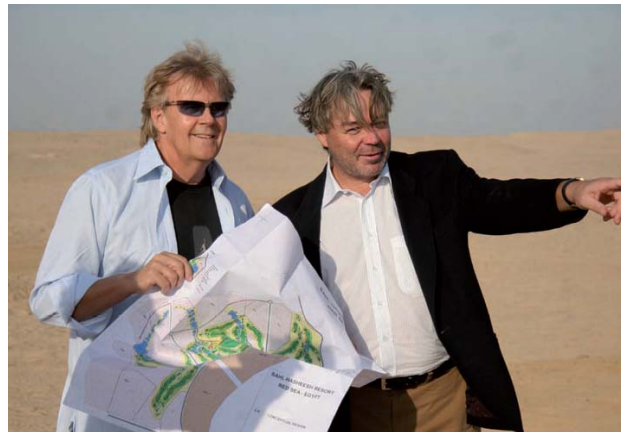
„Spuren im Sand...“ mit Howard Carpendale